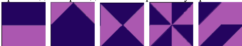
Рис. 1. Образцы для первой серии заданий из 4-х элементов (2 x 2).

Испытуемому дается три серии по пять заданий. При выполнении каждого задания надо сложить из цветных квадратов узор по образцу (см. рис. 1-3). В первой серии, для того чтобы сложить узор, необходимо использовать четыре квадрата, во второй – девять, в третьей – шестнадцать. Внутри каждой серии задания постепенно усложняются, при этом происходит переход от симметричных узоров к несимметричным.